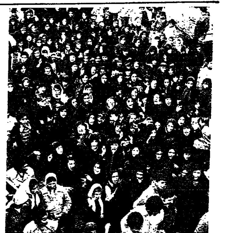
مكثت السيدات اتحن بالمواهبنا واشتركن في مسيرة النبطية